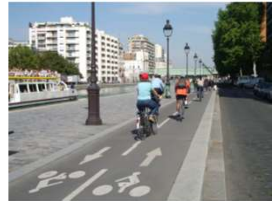
Piste cyclable le long du canal de l'Ourca à Paris.